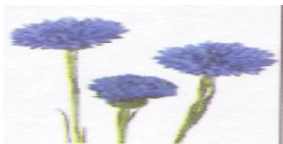
1.Foto Centaurea cyanus.