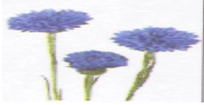
1.Foto Centaurea cyanus.